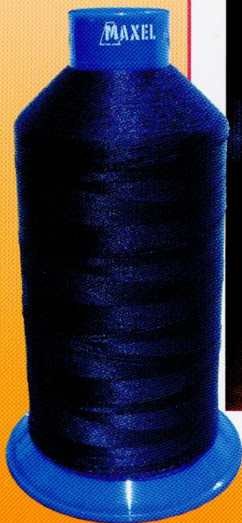
MAXTER CS 100% PES FLAMME RETARDANT TREVIRA CS