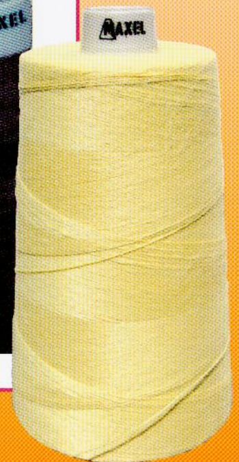
MAXTER TW 100% TWARON PARA ARAMIDE